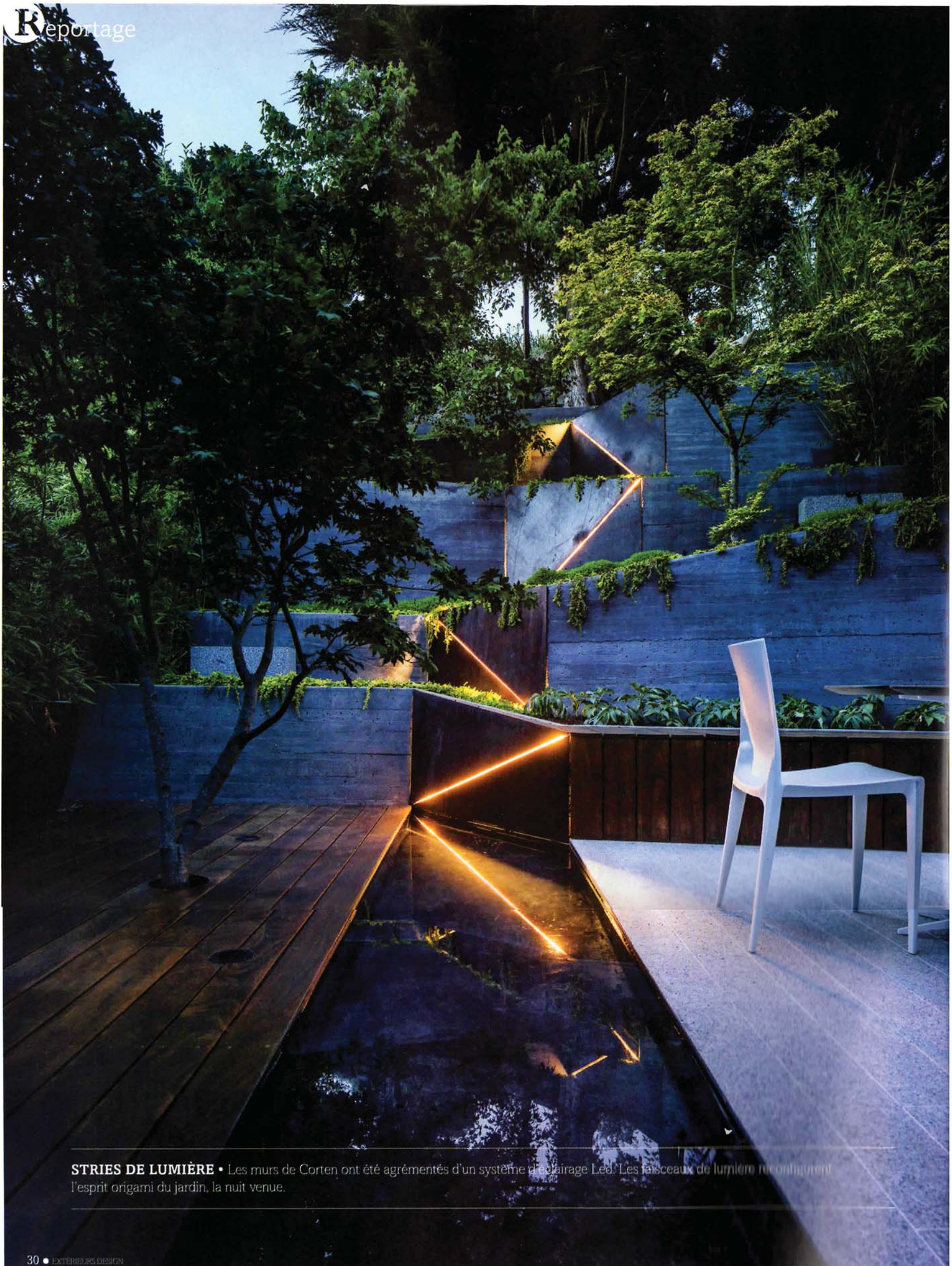
STRIES DE LUMIÈRE • Les murs de Corten ont été agrémentés d'un système d'éclairage Led. Les faisceaux de lumière reconstituent l'esprit origami du jardin, la nuit venue.